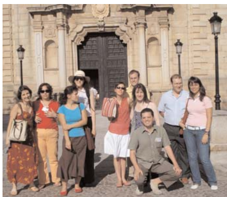
Guías y organizadores en Toledo

El pasado domingo día 8 tuvo lugar en Iglesia de Sto. Tomé la misa de bienvenida para las voluntarias que durante este mes de julio acogerán a los turistas en las iglesias de San Juan de los Reyes y los Jesuitas.