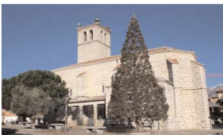
Parroquia de Santa María en Cerceda

En su interior destaca el magnífico retablo fechado entre 1560-1584 de