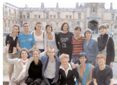
Voluntarios de Oxford y St. Paul (Londres)

Este verano serán 26 los voluntarios españoles que participen en proyectos europeos de la mano de Nártex. Londres, Oxford, Gante, Lovaina, Speyer, Paris, Rouen, Albi, Burdeos, Toulouse, Annecy, Toledo, Venecia y Florencia son, entre otras, las ciudades europeas que acogen en sus iglesias y catedrales estos proyectos.