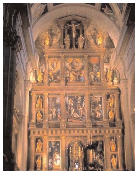
Retablo del Monasterio de El Escorial

En Braojos visitaremos la Parroquia de S. Vicente Mártir. Esta obra posiblemente se iniciase hacia 1617-1621. Lo más destacado se encuentra