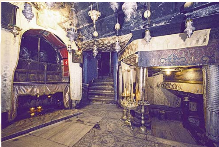
Cueva del Nacimiento

Bajo este magnífico edificio, la gruta del pesebre donde nació el Niño-Dios aglutina todos los sentimientos, todas las emociones. Porque, como dijo Juan Pablo II en su homilía en la plaza del Pesebre de Belén: «La cuna y la cruz son el mismo misterio del amor redentor; el cuerpo que María recostó en el pesebre es el mismo cuerpo ofrecido en la cruz».