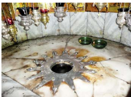
Lugar del Nacimiento, según la tradición

Bien es cierto, que este lugar, una cueva, fue venerado por las primeras comunidades hasta que, en el año 132, Adriano la dedica al dios Adonis-Tamuz y levanta un bosque sagrado. A pesar de esta profanación, el lugar no pasa desapercibido. Tenemos los testimonios de Orígenes, Justino, Eusebio de Cesarea, san Jerónimo o Tertuliano. Pero habrá que esperar dos siglos, hasta que la Iglesia deje de ser perseguida y salga de las